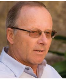
Stephan Schmidheiny, Philanthrop und Unternehmer