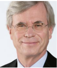
Michael Otto, Unternehmer und Stifter