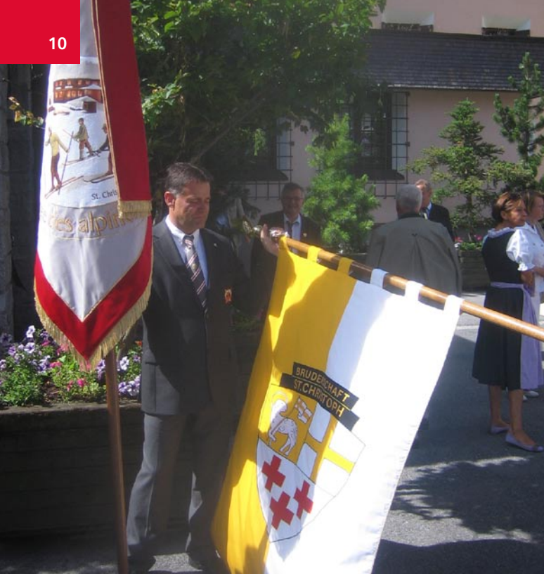
Die Fahne der Bruderschaft St. Christoph