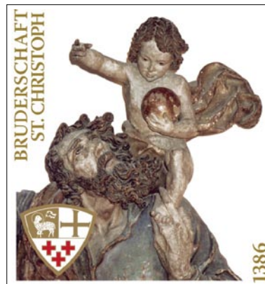
Österreichische Sondermarke der Bruderschaft