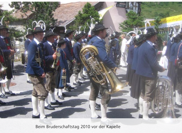
Beim Bruderschaftstag 2010 vor der Kapelle

mit 200.000 € unterstützt. Die Familie hatte buchstäblich kein Dach mehr über dem Kopf. Mit unserer Förderung, einem gleich hohen Zuschuss aus dem Katastrophenfonds, einer Hilfe der Gemeinde, einem Kredit und viel Eigenarbeit konnte das Heim wieder entstehen.