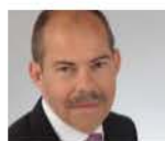
Harald Bott, Hessisches Ministerium der Finanzen