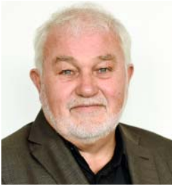
JÜRGEN KOCKA, SOZIALHISTORIKER